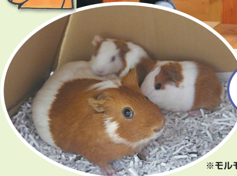
※モルモットのあかちゃん