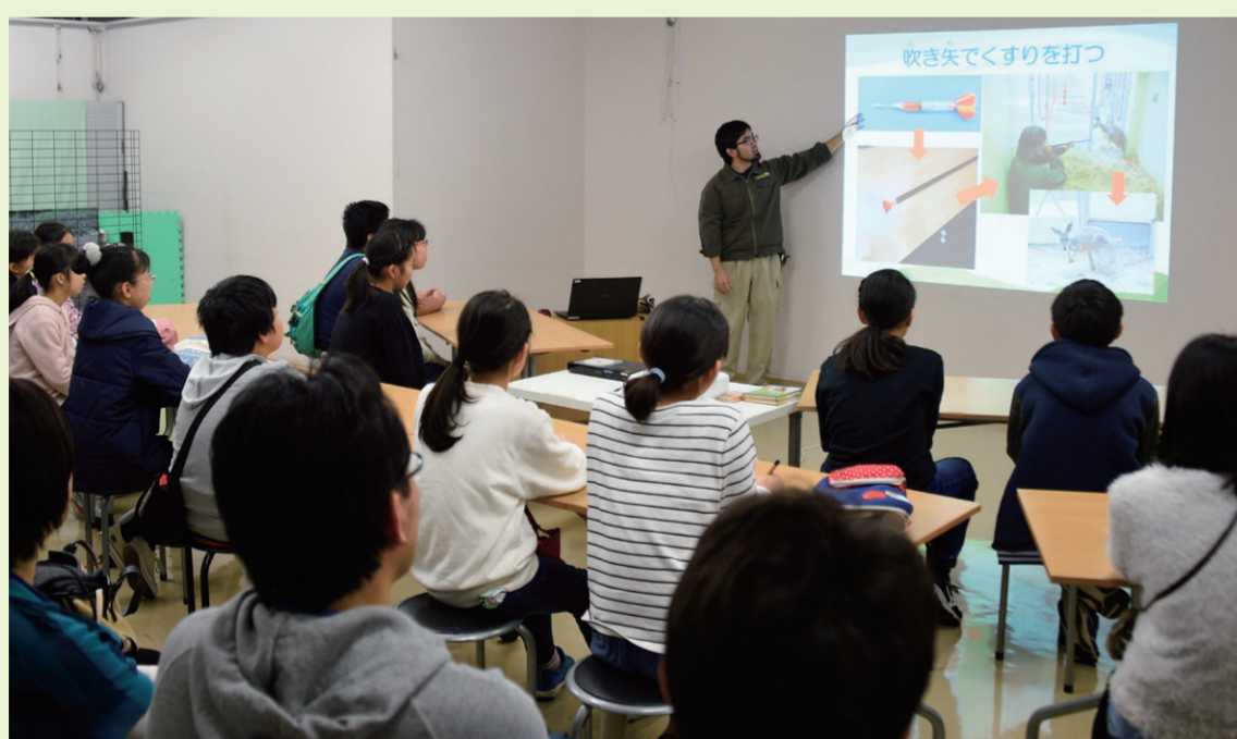
動物園で獣医さんからお話を聞いている様子