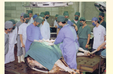
大型動物を使った臨床実習

獣医学教育は6年制です。カリキュラムは大学によって若干の違いはありますが、1~2年次は一般教養と若干の専門教育、3年次から専門教育に入り、4年次以降は実習を含めた専門教育が行われます。獣医師とひと口でいってもその活動内容は多岐にわたっています。大学教育は、それらのすべての専門領域を詳細に教えることはできません。そのため、獣医師免許取得後、それぞれが従事する分野において勉強の日々が続きます。獣医師が働く場所は「いのちの現場」でもあります。若き獣医師たちは、知識や技術だけでなく、「いのちの意味」も学ばなければなりません。